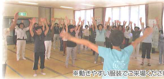
※動きやすい服装でご来場ください